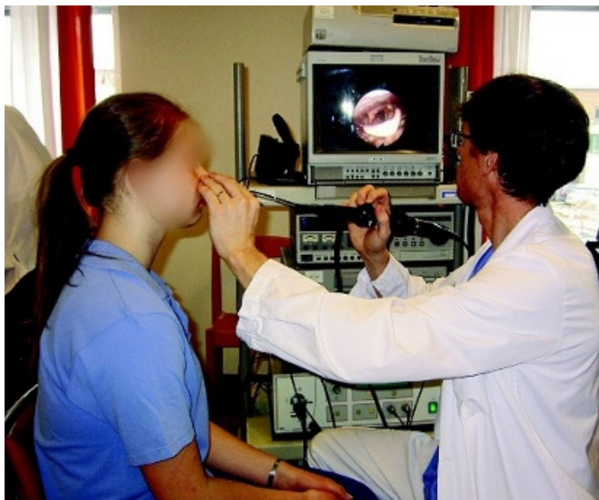
Figur 1. Fiberskopi av larynx med videodokumentation – här utförd i direkt anslutning till ansträngningsprovokation.

rynx vid adduktion och abduktion av stämbanden och hur man kan styra detta viljemässigt. Upplägg med fiberskopiundersökning av larynx under ansträngning är möjlig och förekommer på vissa centra [3]. Att utföra undersökning direkt efter löpning på löpband är enkelt och ofta diagnostiskt (Figur 1).