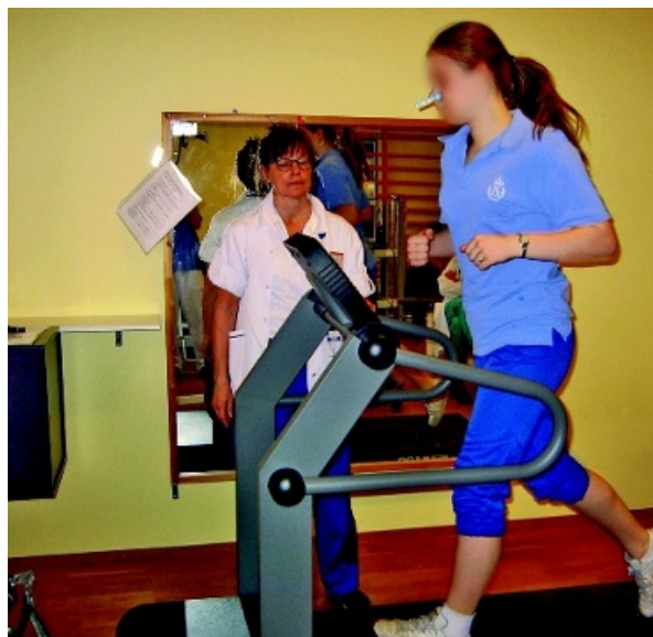
Figur 2. Löpning på löpband under övervakning av sjukgymnast.

Vår erfarenhet av behandling av vocal cord dysfunction sträcker sig fyra år tillbaka i tiden. En noggrann undersökning med vi-