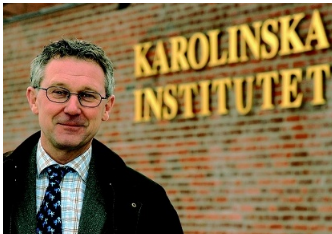
Karolinska institutet har inte medverkat i de vårdavtal som tecknats i Stockholm och har därför svårt att få nya utbildningsplatser i den privata öppenvården.

Annat måste också lösas i avtalen, enligt KI. Det handlar om universitetens inflytande över och tillgång till den sjukvård som används för forskning. Detta regleras idag i de så kallade ALF-avtalen mellan landstingen och universiteten. Den arbetsrättsliga ställningen för dem med kombinationstjänster är en annan fråga.