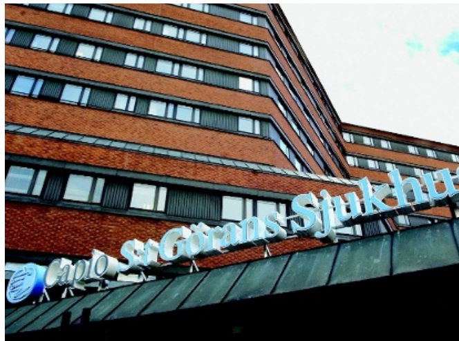
Capho S:t Görans sjukhus i Stockholm är landets hittills enda akut-sjukhus som drivs i privat regi.

En vanlig motivering är att ökad mångfald av vårdgivare är nödvändig för vårdens framtida utmaningar, en snabb medicinsk utveckling och en allt äldre befolkning. Till exempel Vårdföretagarna anser att konkurrensutsättning leder till en effektivare vård utan avkall på kvalitet