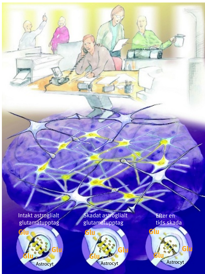
Illustration: Eva Kraft, Göteborg