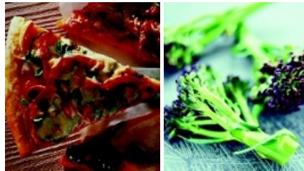
Bilder på mat aktiverade belöningscentra i hjärnan mer vid hunger då leptin gavs till två individer med genetisk oförmåga att uttrycka leptin på sina fettceller.

Aktiveringen av belöningscentra skedde oavsett om försökspersonerna var mätta eller fastande, vilket – med tanke på deras brist på leptin – inte var någon överraskning. Därefter behandlades försökspersonerna med leptin i sju dagar, varefter experimentet upprepades. Det visade sig då att belöningscentra aktiverades i större utsträckning