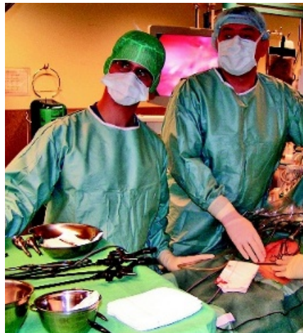
På 100 patienter med perforerad divertikulit har laparoskopiskt peritonealt lavage prövats – med lovande resultat. Bilden: laparoskopisk operation.

I gruppen som genomgick lavage var postoperativ morbiditet och mortalitet 4 respektive 3 procent. Två av patienterna krävde reintervention för (bäcken-) abscess, av vilka en genomgick Hartmanns operation. Av de tre patienter som dog hade två immunsuppressiv behandling efter tidigare njurtransplantation. Endast två patienter återinsjuknade i ny di-