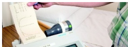
Att få veta sina lungors »biologiska« ålder hade god effekt på motivationen att sluta röka.

En undersökning efter ett år visade att de som fått »åldern« på sina lungor angiven lyckades bryta sin ovana i betydligt större utsträckning än de som endast fått spirometriresultatet. 13,6 procent av in-