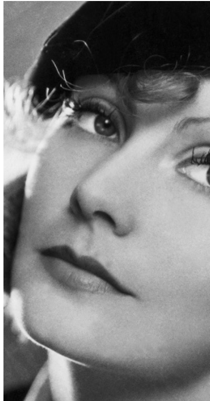
Utseendet har stor betydelse i dagens samhälle, men frågan är om det rättfärdigar transplantation av ett icke-egat ansikte.

Författaren understryker utseendets betydelse och därmed traumat av ett förändrat utseende men undviker att diskutera vad detta innebär för patienten efter en ansiktstransplantation. På samma sätt som ett förändrat utseende på grund av trauma kan innebära kraftig psykisk belastning kan givetvis ett totalt förändrat utseende, åstadkommet med ansiktstransplantation, även om det nya utseendet kan betraktas som »förbätt-