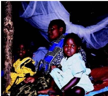
Tanzaniska barn på ett bysjukhus.